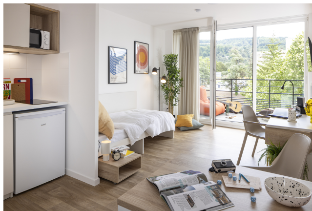
Photo de l'intérieur des logements

Divers équipements sont mis à la disposition des occupants : accès sécurisé avec badge, ascenseur, local à vélos, laverie**, jardin extérieur.