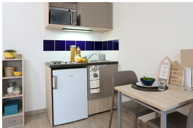
Photo de l'intérieur des logements

Divers équipements sont mis à la disposition des occupants : accès sécurisé avec digicode et badge Vigik, vidéosurveillance, parking**, local à vélos, salle commune avec TV, kit linge**, salle de sport, baby-foot, Wifi (compris dans le loyer), laverie**, prêt d'aspirateur, de table et de fer à repasser ainsi que de sèche-cheveux.