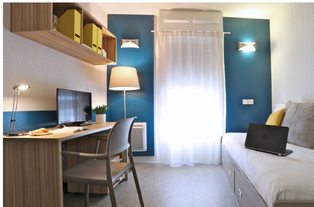
Photo de l'intérieur des logements