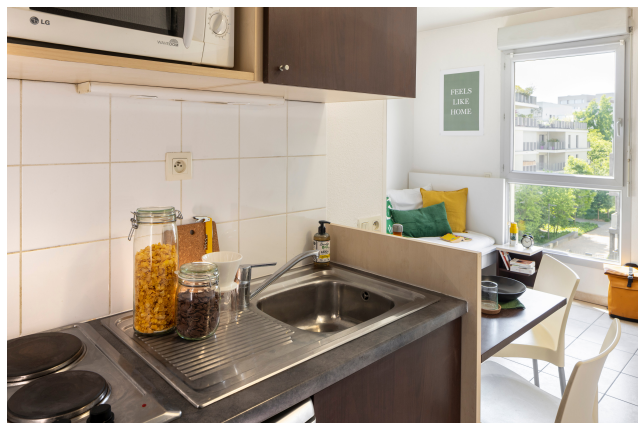
Photo de l'intérieur des logements

Divers équipements sont mis à la disposition des occupants : accès sécurisé avec badge d'entrée et vidéo-surveillance, salle commune, Internet câblé (compris dans le loyer), laverie**, kit linge et kit vaisselle, ménage, local vélo, prêt d'aspirateur, babyfoot, terrasse commune.