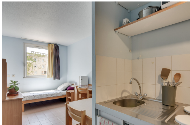
Photo de l'intérieur des logements

Divers équipements sont mis à la disposition des occupants : accès sécurisé avec digicode et vidéo-surveillance, local à vélos clos, Wifi**, parking**, aspirateur en libre service, laverie**, kit linge, salle de travail avec terrasse, table de ping-pong et baby-foot, prêt de service à raclette et fondue, de fer et planche à repasser, terrasse commune extérieure.