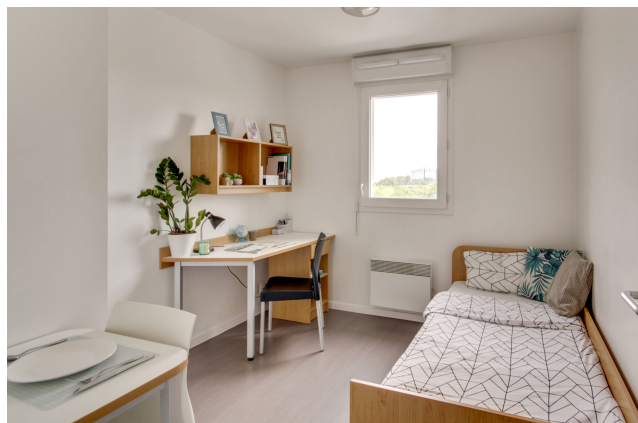
Photo de l'intérieur des logements