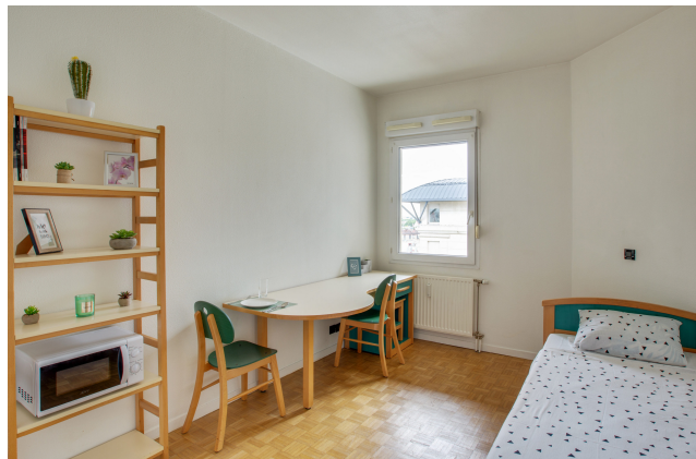
Photo de l'intérieur des logements

Divers équipements sont mis à la disposition des occupants : accès sécurisé avec badge Vigik, surveillance vidéo, salle de coworking, laverie **, kit linge, Wifi**, salle de sport, local à vélos, aspirateur libre service, table de ping-pong et baby-foot, distributeur de boissons, espace troc.