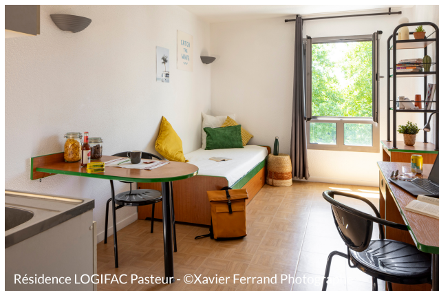
Photo de l'intérieur des logements

Divers équipements sont mis à la disposition des occupants : accès sécurisé avec badge Vigik, salle de coworking, laverie**, kit linge, aspirateur libre service, baby-foot, local à vélos.