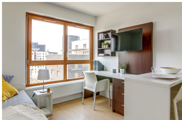
Photo de l'intérieur des logements

Divers équipements collectifs: sont mis à la disposition des occupants : laverie**, accès sécurisé avec digicode/badge vigik, prêt aspirateur, local à vélos, salle commune et de coworking, Wifi**, kit linge**, table de ping-pong, baby-foot.