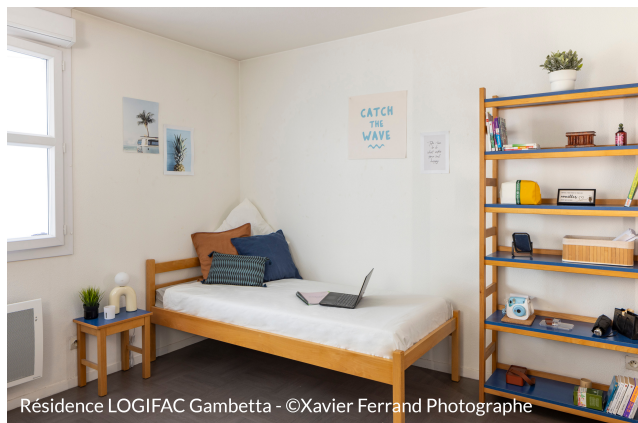
Résidence LOGIFAC Gambetta

Divers équipements sont mis à la disposition des occupants : accès sécurisé avec badge Vigik, salle commune avec ping-pong et baby-foot, laverie**, kit linge, Wifi**, emplacements vélo, aspirateur libre service, salle de coworking.