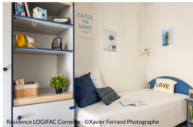
Résidence LOGIFAC Corneille

Divers équipements sont mis à la disposition des occupants : accès sécurisé avec badge Vigik, salle de coworking, table de ping-pong, baby-foot, Wifi**, laverie**, kit linge, aspirateur libre service, local à vélos, prêt aspirateur.