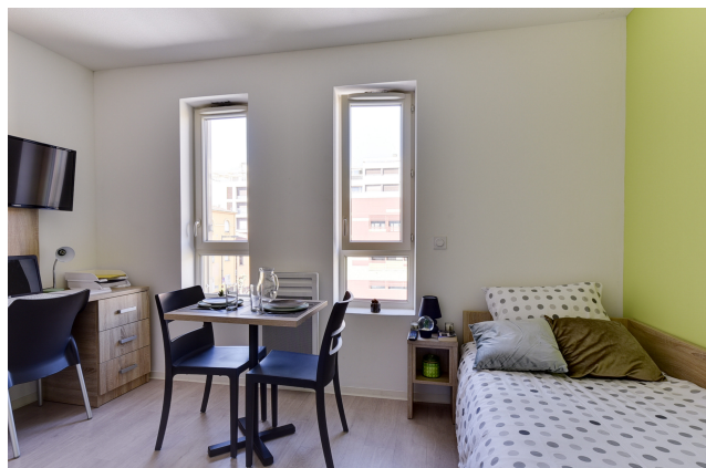
Photo de l'intérieur des logements

Divers équipements sont mis à la disposition des occupants : accès sécurisé avec digicode et badge Vigik, vidéosurveillance, laverie**, local à vélos, Wifi (inclus dans le loyer), salle commune servant à la fois d'espace de travail et de détente avec télévision, baby foot et espace d'échange de livres, d'aliments non périssables, de matériel divers. Kit linge, espace extérieur commun, salle de coworking, prêt d'aspirateur, de fer et planche à repasser, ainsi que de service à raclette et à fondue, distributeur de boissons fraîches, friandises et boissons chaudes.