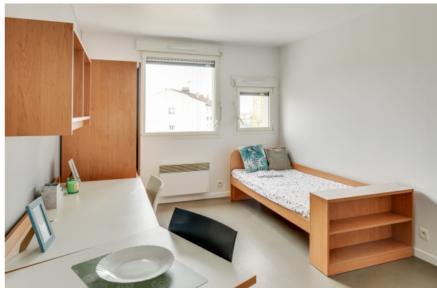
Photo de l'intérieur des logements