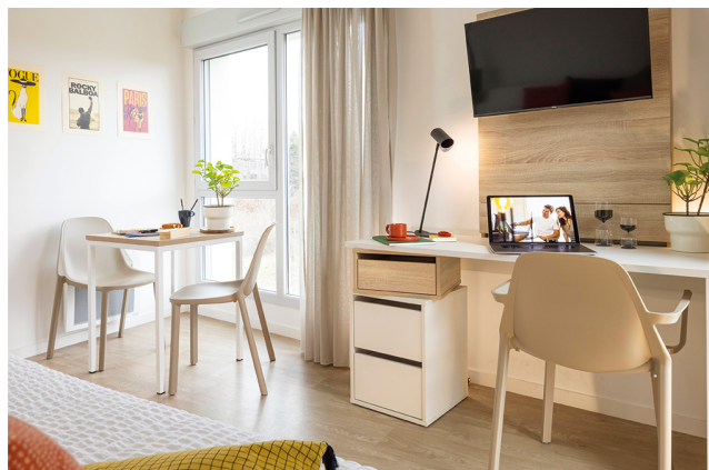
Photo de l'intérieur des logements