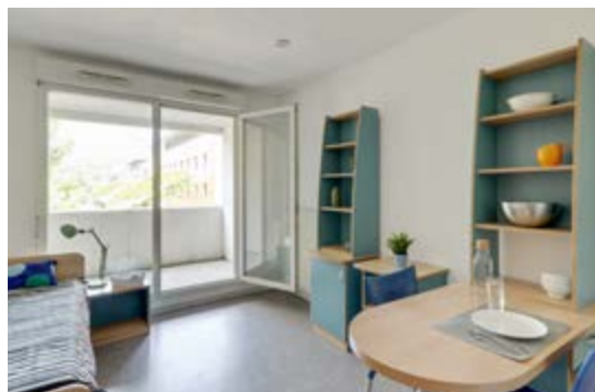
Photo de l'intérieur des logements

Divers équipements sont mis à la disposition des occupants : badge Vigik, laverie**, salle de sport, table de ping pong, aspirateur en libre service, Wifi, salle commune, local à vélos.