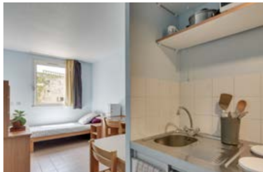
Photo de l'intérieur des logements

Le chauffage et l'eau chaude sanitaire sont fournis collectivement.