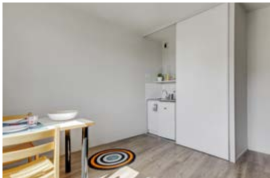
Photo de l'intérieur des logements

Certains studios ont été conçus pour permettre le passage et la rotation d'un fauteuil roulant.