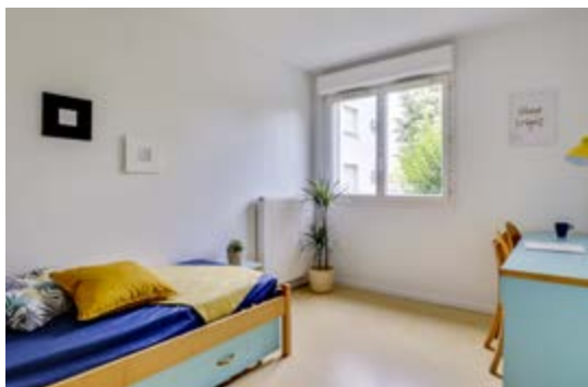
Photo de l'intérieur des logements

Certains logements ont été conçus pour permettre le passage et la rotation d'un fauteuil roulant.