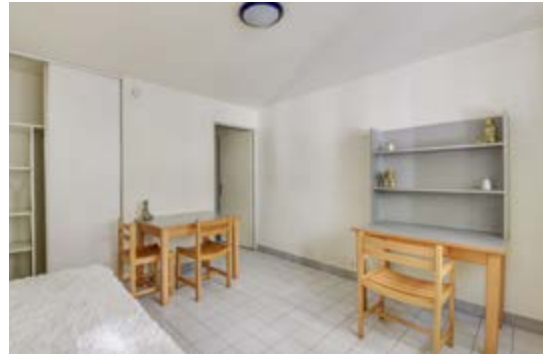
Photo de l'intérieur des logements