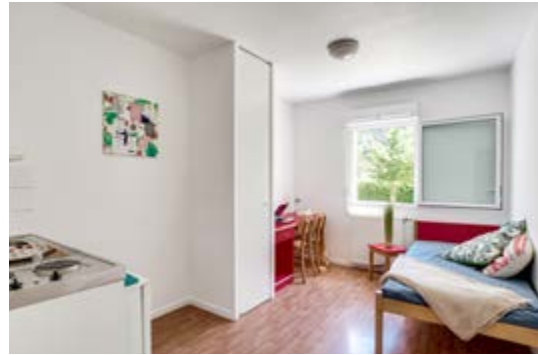
Photo de l'intérieur des logements

Les logements doubles destinés à la colocation comportent deux chambres.