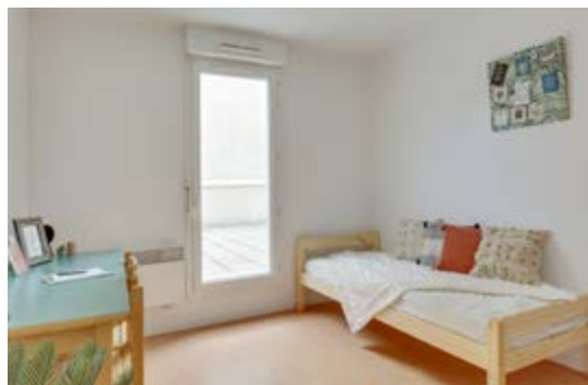
Photo de l'intérieur des logements